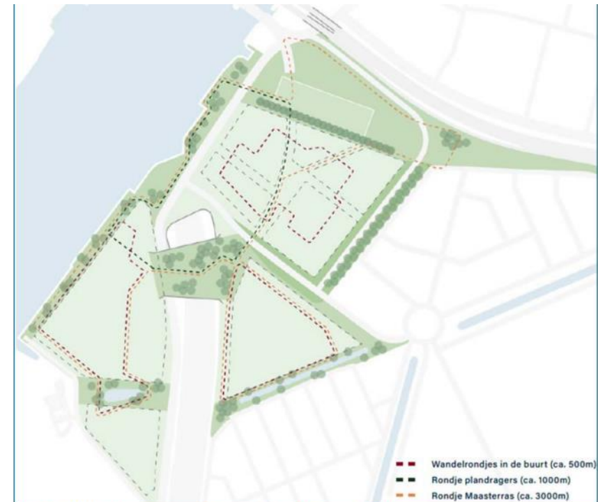
Figuur 16.15 Wandelroutes binnen Maasterras