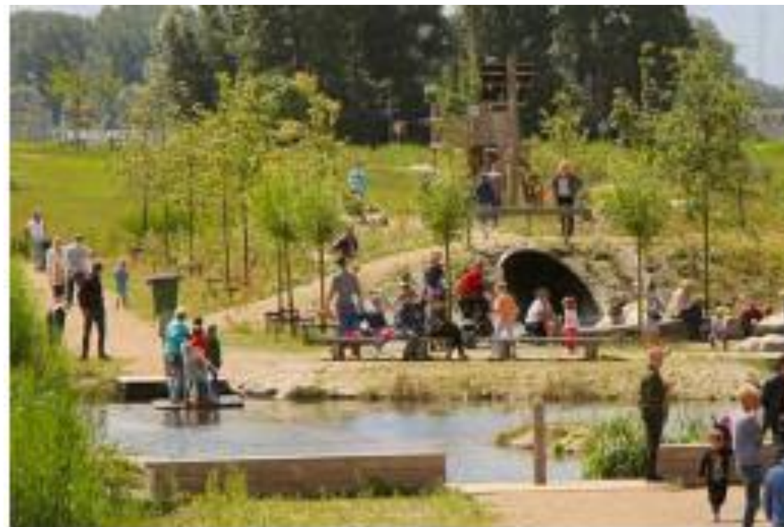
Speelplaats in combinatie met water.