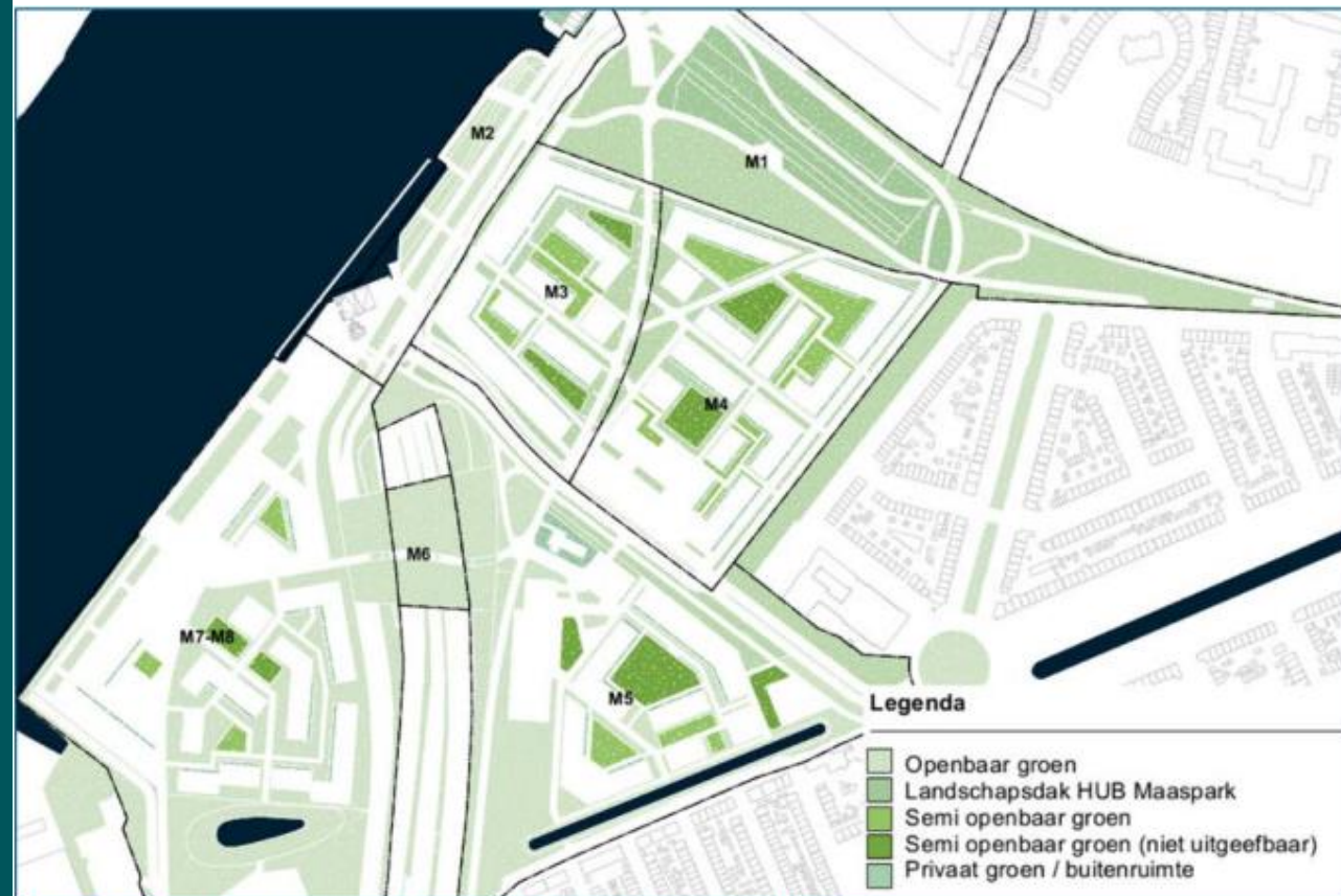
Figuur 16.6 Verdeling van openbare ruimte binnen de deelgebieden