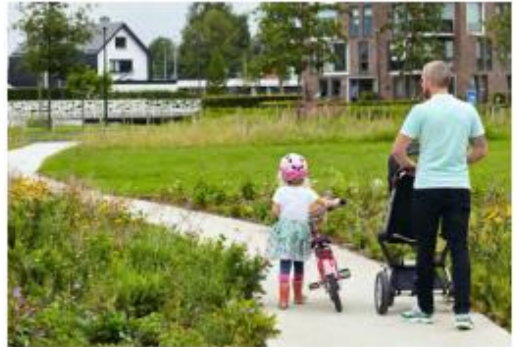
Wandelrondjes geschikt voor alle leeftijden.