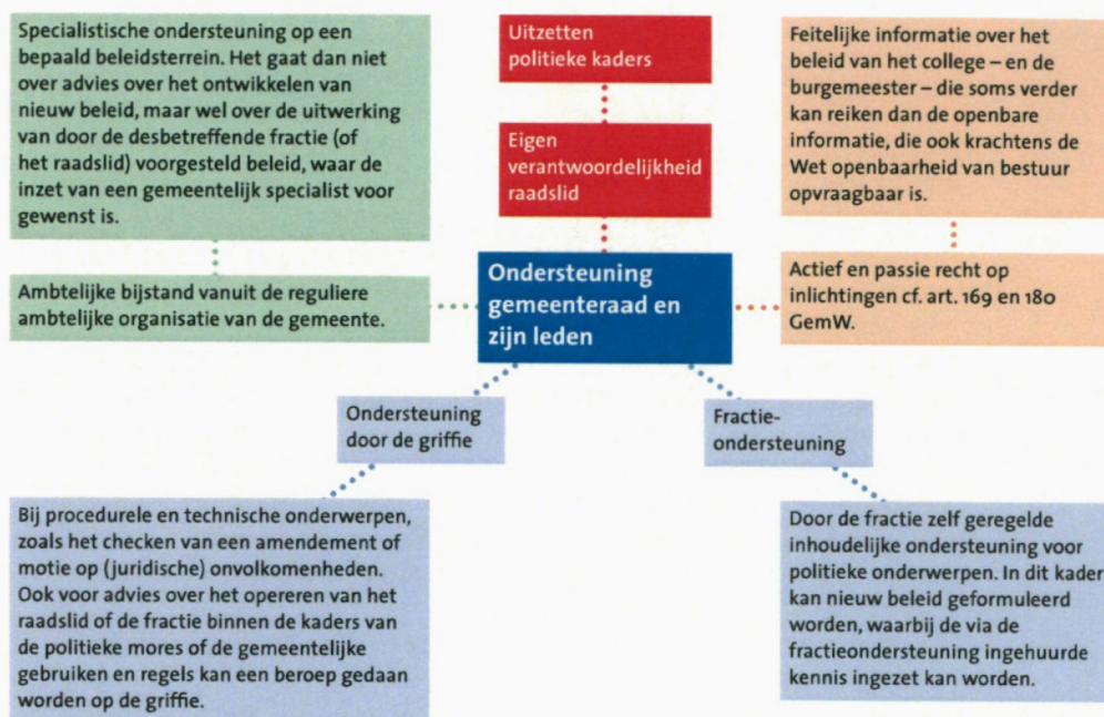
Figuur Ondersteuning gemeenteraad en zijn leden 21

Naast dit systeem van inhoudelijke ondersteuning staat de onafhankelijke rekenkamer. 22 De introductie van de rekenkamer op decentraal niveau was één van de aanbevelingen van de Staatscommissie Dualisme en lokale democratie. 23 De Staatscommissie achtte de instelling van onafhankelijke rekenkamers noodzakelijk als onderdeel van de door haar bepleite versterking van de controlerende taak van de gemeenteraad en provinciale staten. Gedegen, onafhankelijk rekenkameronderzoek naar de doeltreffendheid, doelmatigheid en rechtmatigheid van het gevoerde bestuur zou de decentrale volksvertegenwoordiging in staat stellen om in de gedualiseerde verhoudingen de controle te verbeteren op de bereikte effecten van beleid en de besteding van middelen.