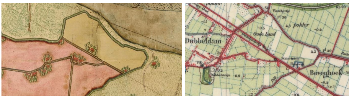
Plangebied en omgeving in 1611 en 1950

Direct ten zuiden van het plangebied, tussen de Haaswijkweg Oost (vroeger Reeweg) en de Provincialeweg stond tussen 1603 en circa 1870 een niet bij naam bekende boerderij. Mogelijk was dit een onderhorige boerderij van de oorspronkelijk 17 e -eeuwse buitenplaats Haaswijk die circa 500 meter oostelijker aan de Haaswijkweg Oost stond. Sinds 1931 staat op de locatie van de 17-eeuwse boerderij een nieuwe boerderij, Haaswijkweg Oost 10.