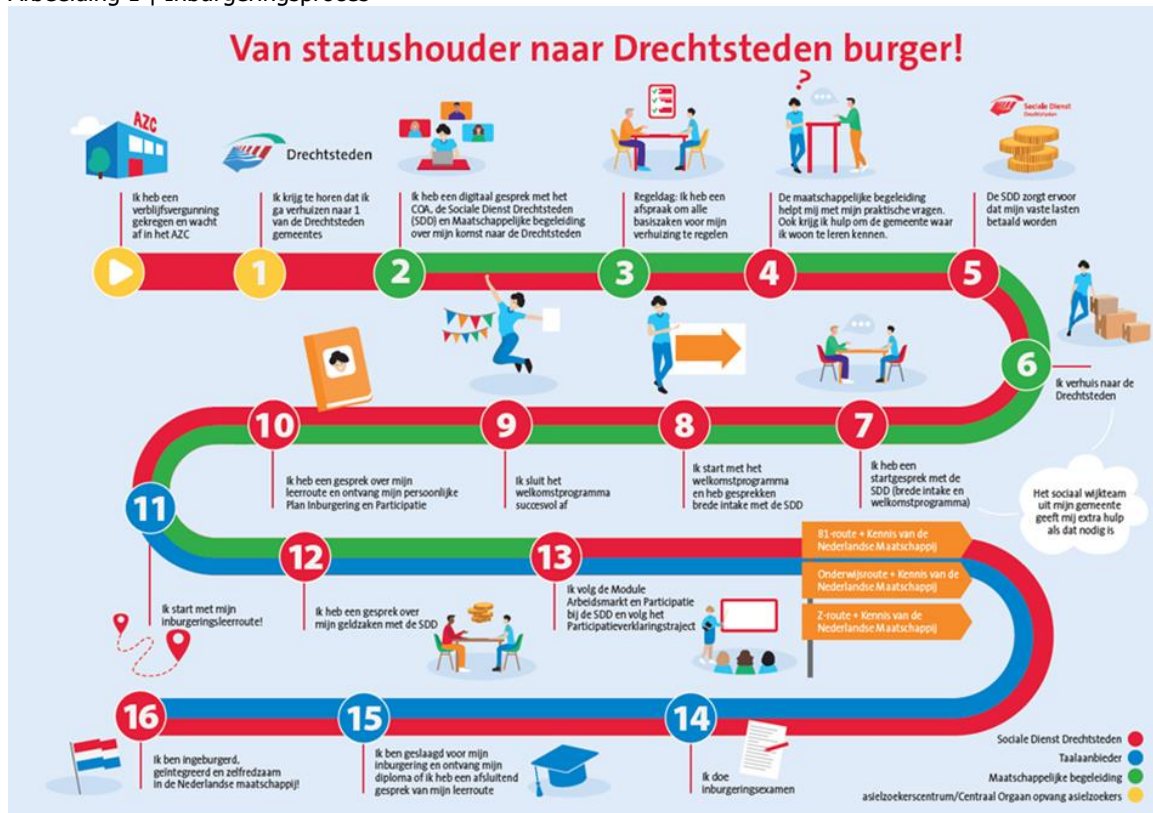
Afbeelding 1 | Inburgeringsproces

De inburgeringsketen loopt vanaf het moment van de warme overdracht met het COA tot en met behalen van het inburgeringsdiploma (gevolgd door verdere integratie in de samenleving). Een groot deel van de inburgeringsketen betreft de onderdelen/taken die door de SDD op basis van de DVO worden uitgevoerd (zie Hoofdstuk 3). In aanvulling op die onderdelen is de keten verder opgebouwd uit inburgeringsvoorzieningen (leerroutes) en maatschappelijke begeleiding (incl PVT, financiële zelfredzaamheid).