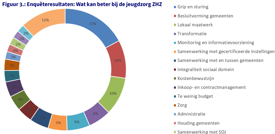
Figuur 3.: Enquêteresultaten: Wat kan beter bij de jeugdzorg ZHZ