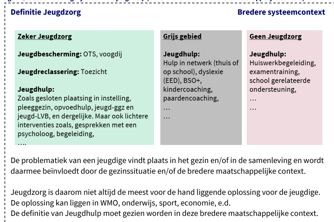
Figuur 7.: Illustratie mogelijke definitie jeugdhulp (bezien vanuit haar bredere maatschappelijke context)