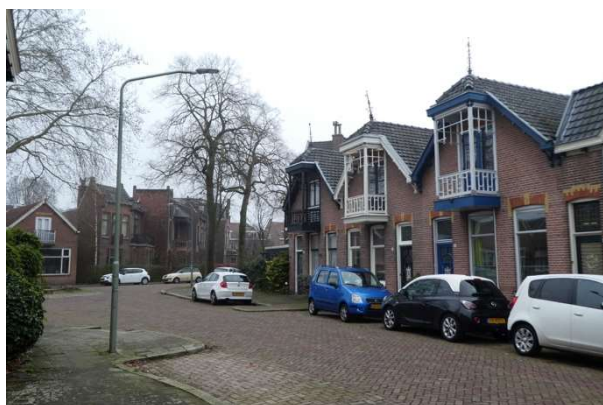
met zicht op de Willemstraat