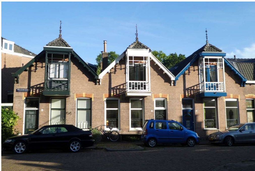
Alexanderstraat 2,4 en 6, juli 2019