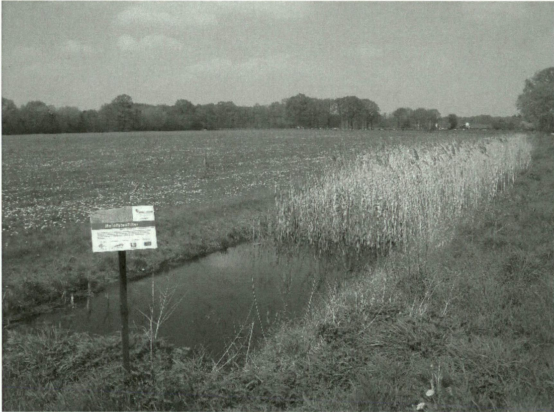
Eenvoudig voorbeeld van een helofytenfilter

http://www.kilianwater.nl/nl/helofytenfilters.html