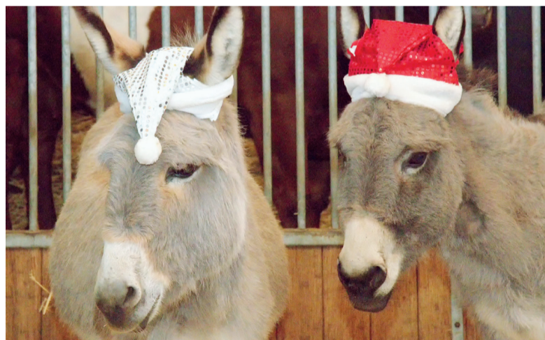
Kerststal op Stadsboerderij Weizigt

Donderdag 19 december viert Duurzaamheidscentrum vlak voor de kerstvakantie alvast een eigen kerstfeestje op de Stadsboerderij. Neem een kijkje bij de levende kerststal en kom helemaal in de feeststemming. Weizigt nodigt iedereen, jong én oud, van harte uit om de feestdagen in te komen luiden.