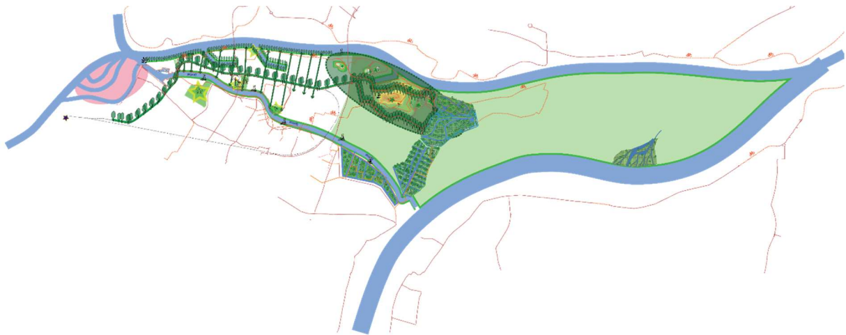
Figuur 4: versterking van de identiteit tussen Binnenstad en Biesbosch, verbeteren toegankelijkheid van de Biesbosch.

De mogelijkheden voor HOV worden nog verkend.