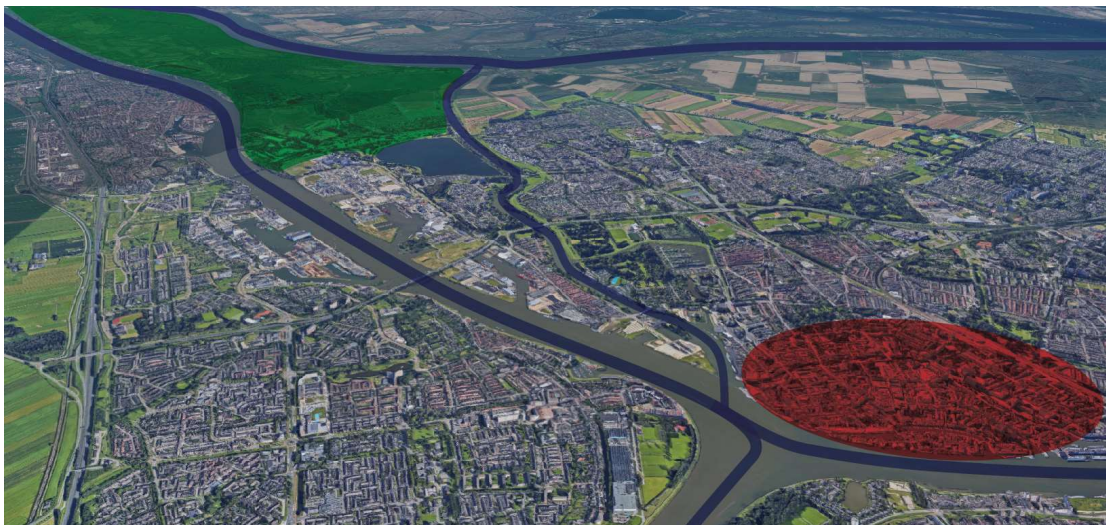
Figuur 2: de Staart tussen Merwede en Wantij, Biesbosch en Binnenstad

De visie gaat uit van de unieke positie van de Staart tussen Merwede en Wantij, en tussen de binnenstad en Biesbosch. Hieruit volgen andere uitgangspunten, waarin de buurt wordt verbonden met deze bijzondere plekken.