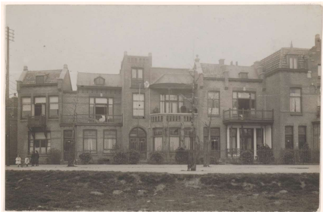
1910, Willemstraat 1-9 (van rechts naar links)