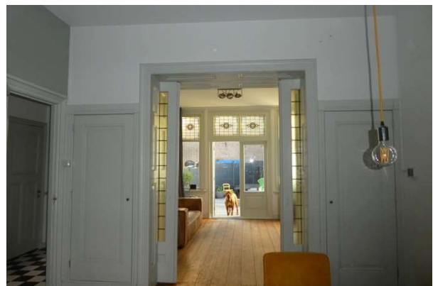
zicht op achterkamer