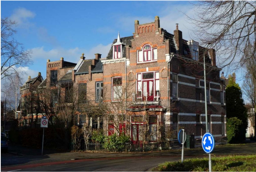
Willemstraat, hoek Dubbeldamseweg Zuid