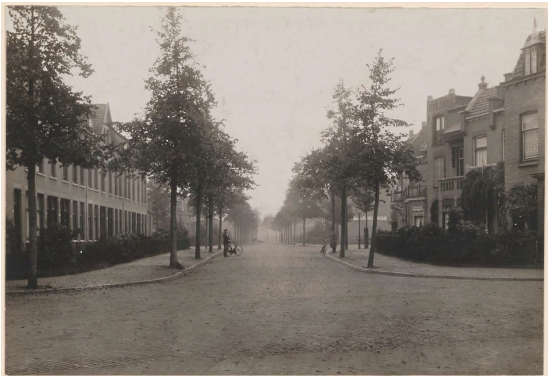
1920 Willemstraat met rechts Willemstraat 1-9