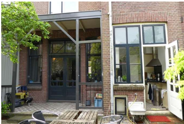
achtergevel met veranda