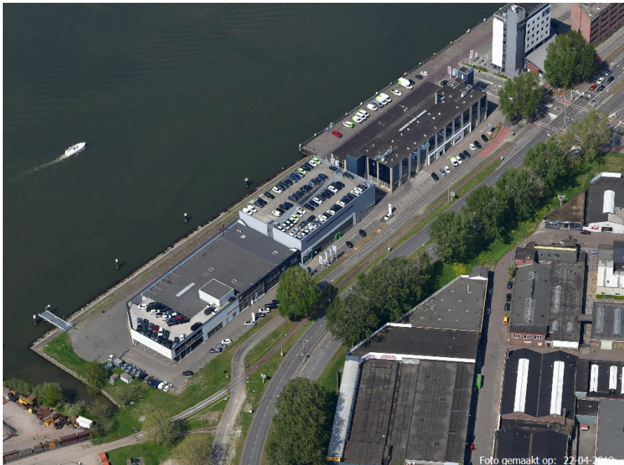
huidige situatie Handelskade

De bedrijven ter plaatse van de Handelskade worden nu ontsloten via de kruising met de Laan der Verenigde Naties ter hoogte van de Handelskade. De Handelskade is voornamelijk toegankelijk voor bestemmingsverkeer met aan de zuidkant van de Handelskade een keerlus.