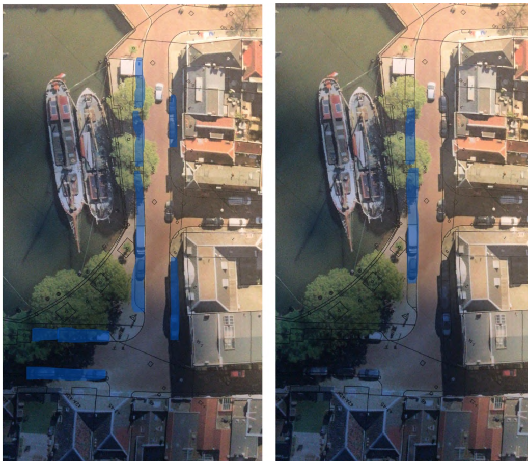
Parkeren op 't Vlak: links de bestaande parkeerplekken in blauw, rechts in de voorgestelde situatie. Dan vervallen daar 5 parkeerplaatsen maar wordt de stoep én de kade breder.

Het gebied van de haven en daaromheen trekt steeds meer bezoekers die lopend deels van de stoep en de kades en deels van de rijweg gebruik maken. Hier valt nog veel aan te verbeteren. Daarbij ziet de werkgroep verschil tussen 't Vlak en de overige delen. Vooral aan de Kuipershaven en 't Vlak is de huidige stoep te smal om prettig op te lopen en wijkt men uit naar de straat. De werkgroep stelt voor om beide loopzones te verbreden waarbij er vanwege het wat intensievere autoverkeer op 't Vlak een hoogteverschil tussen de rijweg en de stoep blijft.