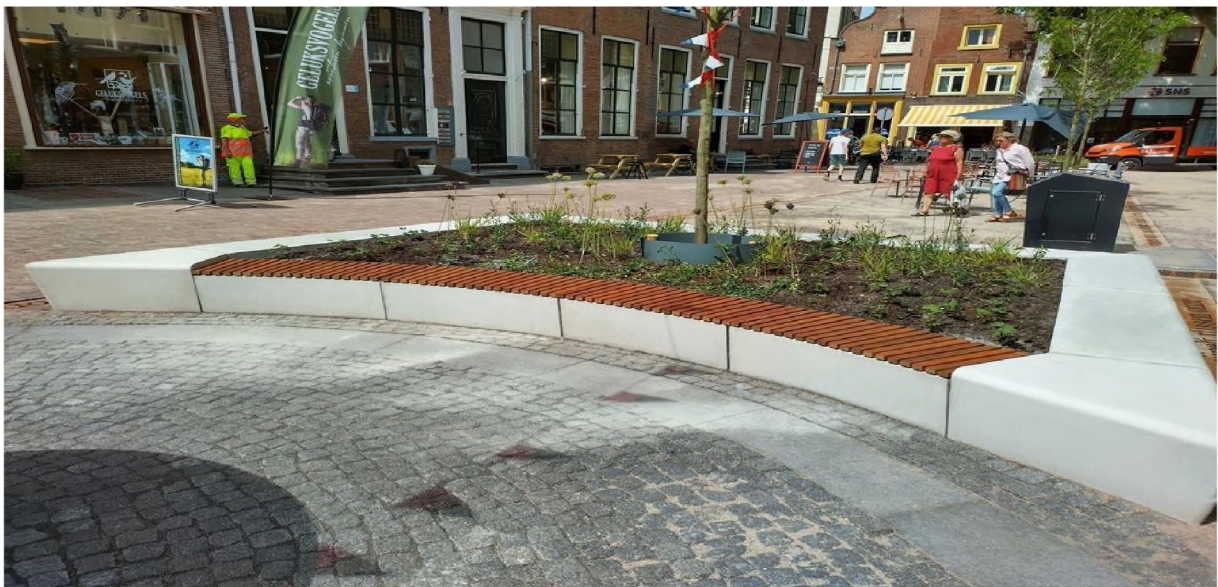
Voorbeeld van groot zitelement