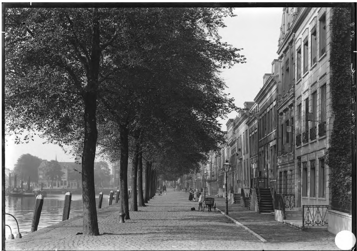
Historische foto Wolwevershaven, met uniforme vlakke bestrating

Qua bestrating en uitstraling stelt de werkgroep voor om één uniforme bestrating voor het gebied toe te passen. Alleen in kleur van bestrating of vorm van bestrating bestaat dan verschil tussen de wegdelen. De wegdelen liggen op dezelfde hoogte, waarbij het hoogteverschil van de stoeprand komt te vervallen. Door het vervangen van trottoirtegels door een bredere strook met gebakken klinkers in waalformaat en hardsteenstroken als visuele scheiding is er aansluiting met de rest van de binnenstad.