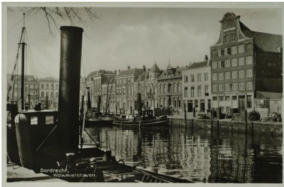
Wolweershaven als werkhaven

De schippers hebben nu een deel van de kade ter beschikking om onderhoud aan het schip te kunnen plegen. Dit blijft bestaan en er wordt gekeken of dit op een overzichtelijke, opgeruimde manier kan worden vormgegeven.