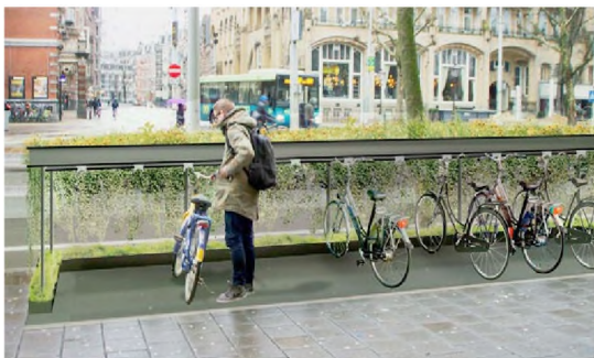
Voorbeeld fietsparkeren in groene hubs

De 'nietjes', de huidige fietsenrekken, leveren een onnodig rommelig beeld op. Daarnaast is de wens van de gemeente dat er meer deelfietsen gebruikt gaan worden. Dat betekent ook meer behoefte aan mogelijkheden om fietsen te stallen. Voorgesteld wordt om dat te doen in de vorm van hubs, fietsenrekken met een groene huls. Hubs voor deelfietsen komen bij de Schrijversstraat, bij het Patriciërshuis en aan de zijkant van Jongepier. Naast de hubs voor deelfietsen komen er voldoende fietsenrekken bestemd voor bewoners/bezoekers.