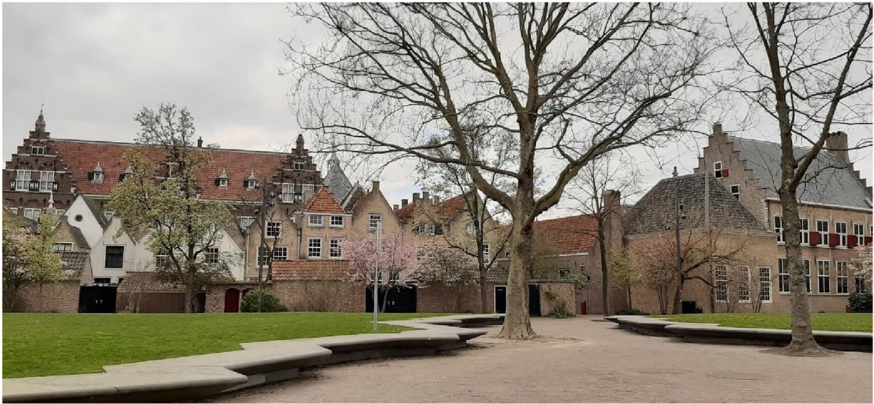
Voorbeeld van groot zitelement, Kloostertuin

In de huidige opstelling van de zitbankjes zit weinig logica. Samenhangende zitelementen, gecombineerd met groen en op specifieke plekken geven een impuls aan de beleefbaarheid van de haven. Deze zitelementen kunnen komen op de kop van de Wolwevershaven/Damiatebolwerk, tegenover Amicitia, bij het dok Straatman en tussen Damiatebrug en Grootthoofd. Daarnaast worden bewoners gestimuleerd om zitjes en groen voor hun woning te plaatsen. De nieuwe inrichting geeft daarvoor nu ook op de Kuipershaven en 't Vlak meer mogelijkheden.