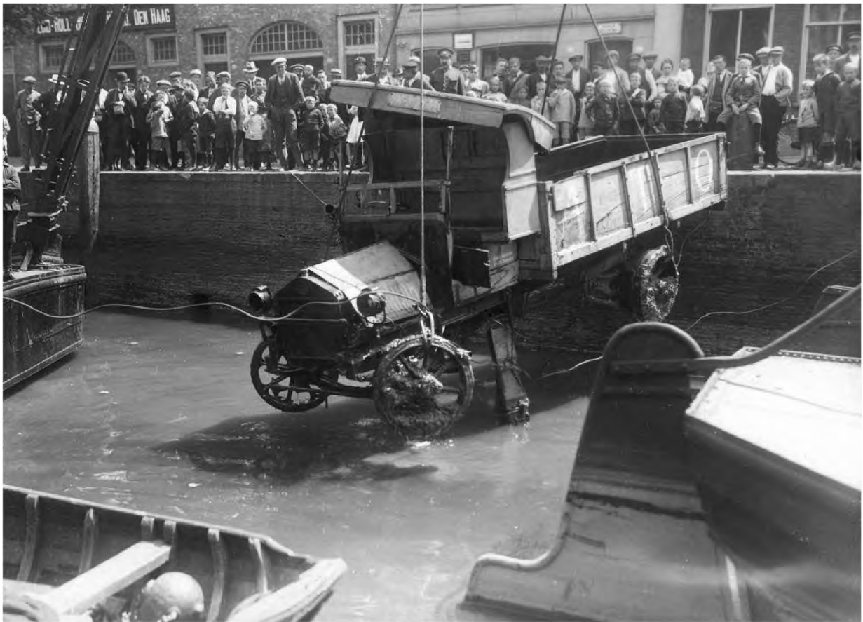
Vroeger gebeurden er ook al ongelukken met vrachtwagens

Het vrachtverkeer dat nu de horeca aan het Groothoofd bevoorraadt is groot en kan slecht keren. Het volgt nu vanaf de Prinsenstraat een onlogische en kwetsbare route door de historische binnenstad. Dit levert op de Kuipershaven een gevaarlijke situatie op. Een logisch alternatief is het maken van een laad- en losplek aan de Wijnstraat, ter hoogte van Bellevue. De Noordendijk en Torenstraat zijn beter ingericht op het grotere verkeer.