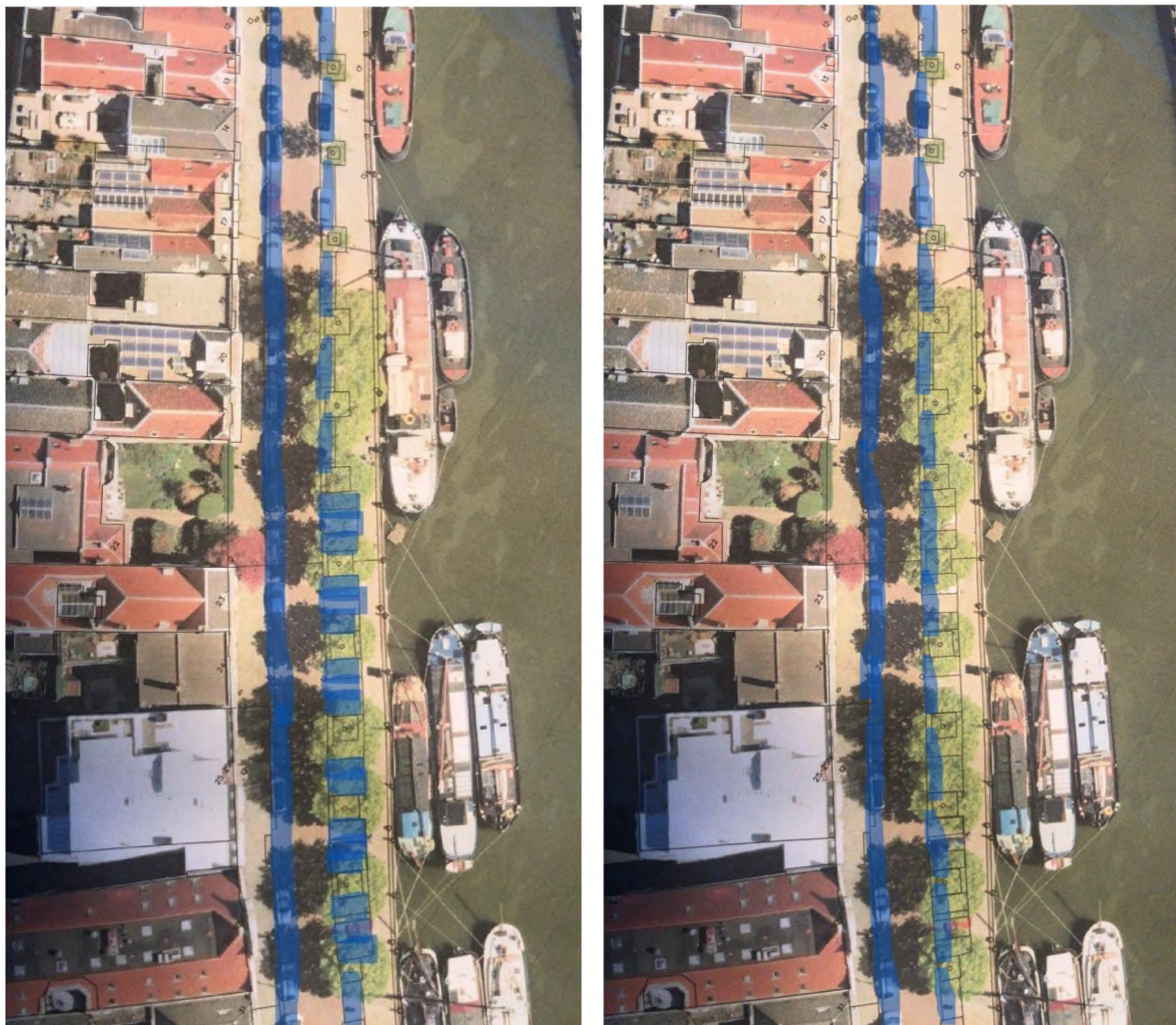
Wolwevershaven: Links de bestaande parkeervakken in blauw, rechts met alleen langsparkeren aan de havenzijde waardoor een veel rustiger beeld en ruimere kade ontstaat. Dit kost wel 10 parkeerplaatsen.

Aan de Wolwevershaven en 't Vlak moet de wandelpromenade over de kade langs het water meer uit de verf komen. Dit kan door deze duidelijk aan te geven in de bestrating en de hoogteverschillen die nu aanwezig zijn door wortelopdruk en achterstallig onderhoud uit te vlakken. Door het vervangen van haaks parkeren onder de bomen aan de Wolwevershaven door parkeren langs de straat, het verbeteren van de locaties voor het parkeren van fietsen en door het vervallen van parkeerplaatsen aan de zijde van de bebouwing op 't Vlak, komt meer ruimte beschikbaar voor een royale continue wandelpromenade over de kade langs het water. Tenslotte wordt de Kuipershaven vanaf de Damiatebrug een autovrije verblijfplaats. Met slechts één oversteek vanaf de Nieuwe Haven is daarmee een conflictvrije wandelroute tot en met het Groothoofd gerealiseerd.