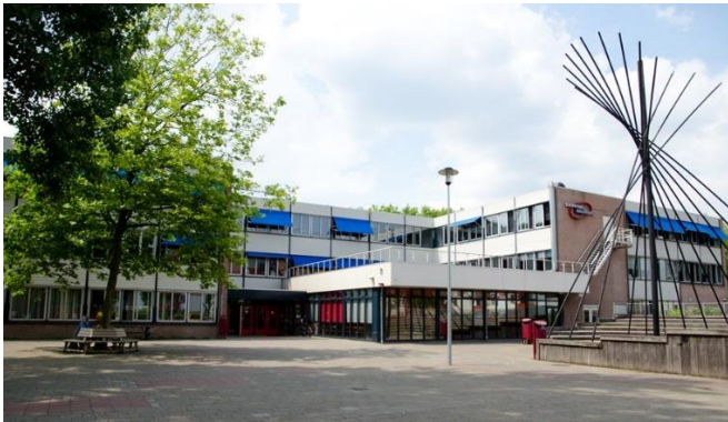
Gebouw uit 1981 mavo, gemengde leerweg, havo 868 leerlingen in 2022 (excl. vavo); 891 leerlingen in 2023 (excl. vavo)