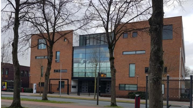
Gebouw uit 2005

Vwo-onderbouw, havo-onderbouw, mavo, GL, vmbo-basis en kader, praktijkonderwijs. Huisvestingskosten praktijkonderwijs zijn doorgedecentraliseerd: geen deel van dit IHP. Profiel vmbo: Dienstverlening en producten (PIE; M+T; E+O; Z+W). Ook aanwezig: Gemengde leerweg; Leerwegondersteuning; Leerwerktrajecten. 857 leerlingen (excl. vavo) in 2022; 872 leerlingen (excl. vavo) in 2023.