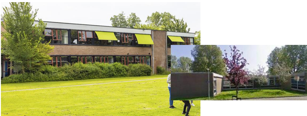
Gebouw uit 1974 ISK 150 leerlingen 2022; 212 leerlingen 2023 plus 171 leerlingen in de school voor Oekraïense leerlingen aan de Wielingenstraat (foto rechts).