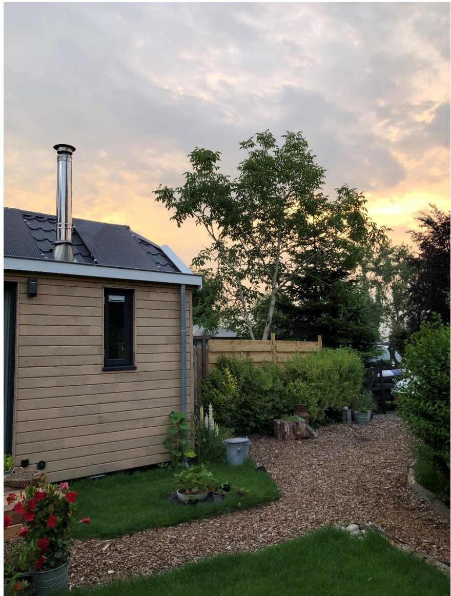
Tiny House Drechtsteden 02/08/2020