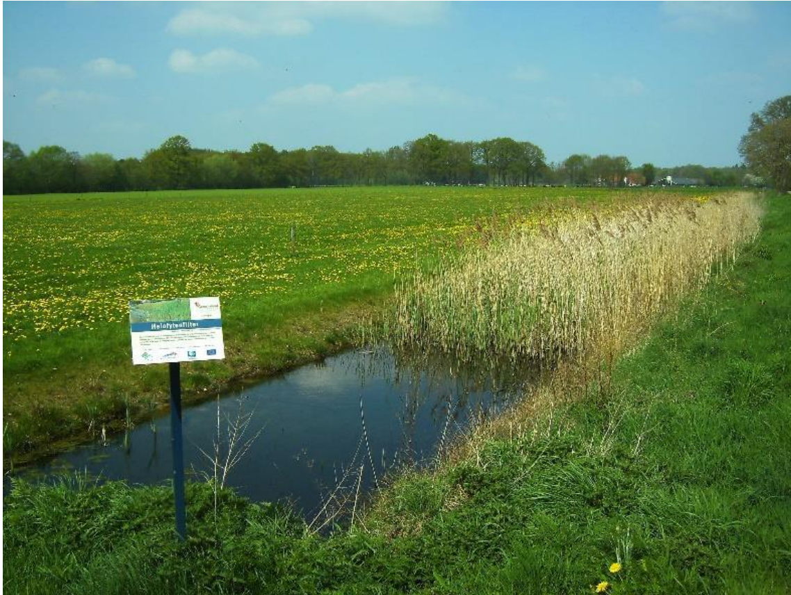
Eenvoudig voorbeeld van een helofytenfilter

http://www.kilianwater.nl/nl/helofytenfilters.html