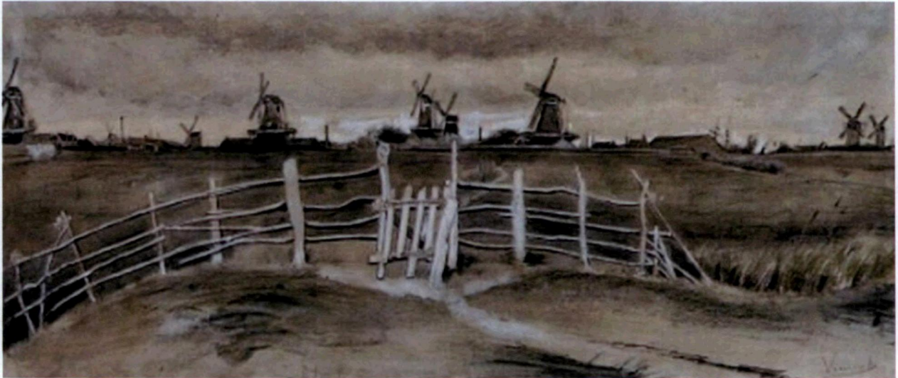
Schilderij van Vincent van Gogh van de Weeskinderdijk gemaakt in Augustus-September 1881