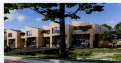
Interpretatie van de dijkwoning door hoogteverschillen.