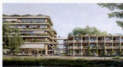
Incidenteel hoger en breder volume.

Entrees Hoofdentree van woningen bevindt zich aan de dijkzijde.