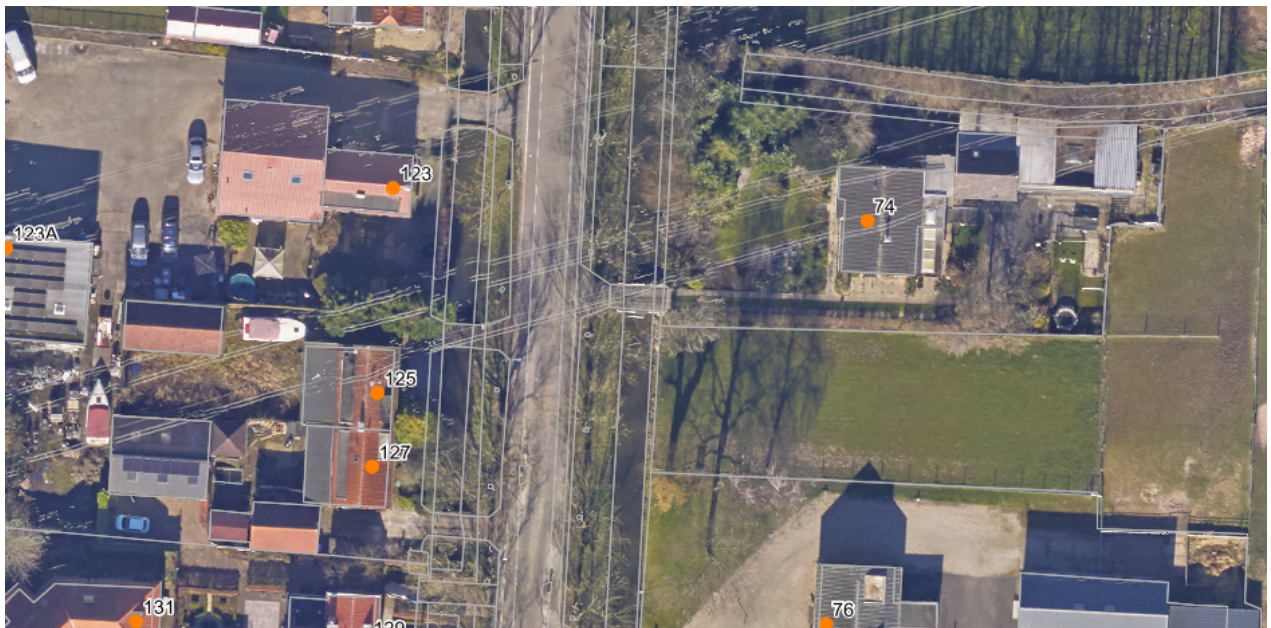
Luchtfoto huidige situatie Rijksstraatweg 74 (rechts) en Rijksstraatweg 125/127 (links)

Rijksstraatweg 74 grenst in het noorden aan open groen gebied en in het zuiden aan een andere woning met bedrijf. De percelen van Rijksstraatweg 125 en 127 grenzen aan andere percelen met woningen. Bij deze woningen zitten bedrijven op het perceel erbij. Beide woningen zijn monumenten.