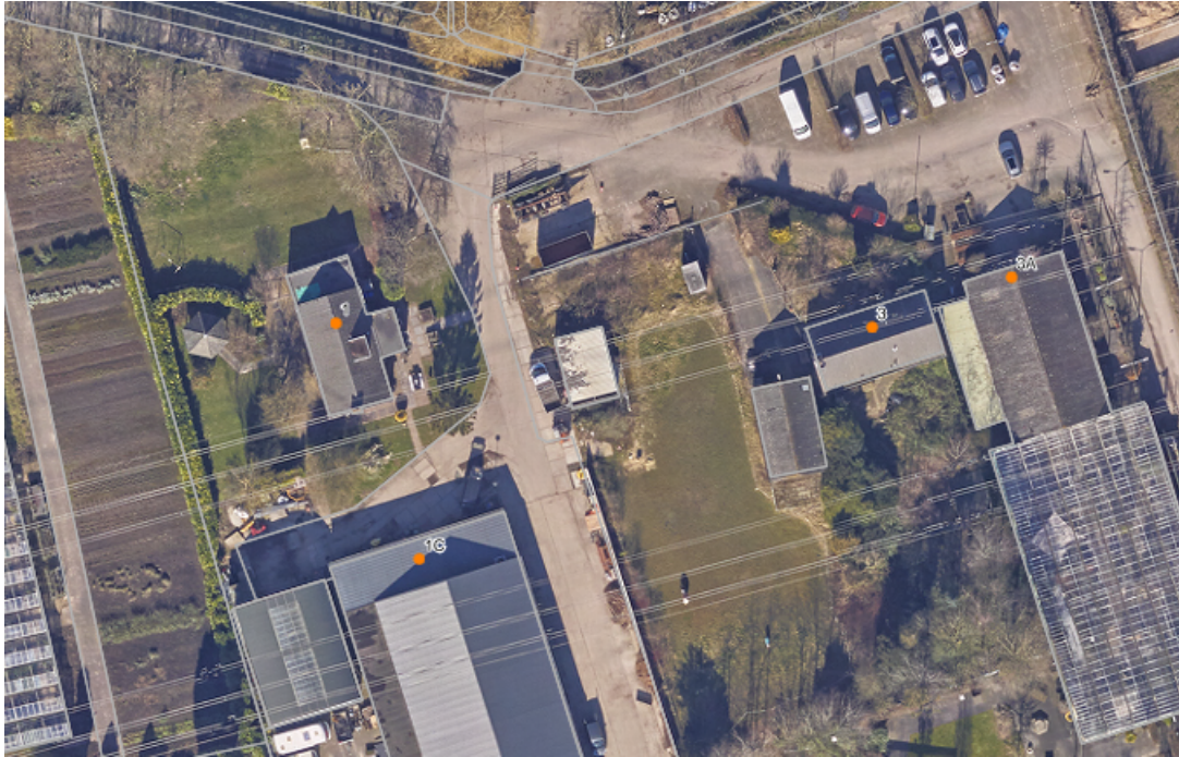
Luchtfoto huidige situatie Zuidbuitenpoldersekade