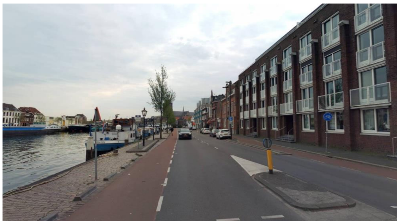
Achterhakkers, gezicht vanuit het zuiden

De lage kade langs de Kalkhaven en de Spuihaven is op dit moment geen aantrekkelijke wandelroute. Dit heeft te maken met de slechte bestrating en de verschillende obstakels op de kade, zoals bolders, walstroomkasten, fietsen, voetplanken naar de schepen en de bomen. Behalve de bomen is er geen groen op de kade. Het trottoir tussen de autoweg van de Achterhakkers en de keermuur is te smal om dienst te doen als wandelroute. De fietsstroken langs de rijwegen zijn met name in de bocht kwetsbaar door het ruimtegebrek.