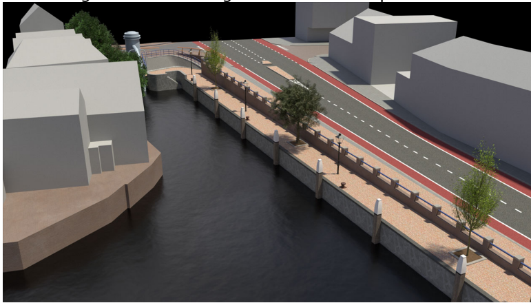
Impressie ontwerp verbreding kade Achterhakkers, ter hoogte van de Spuihaven

Dit heeft geleid tot het volgende 3D beeld impressie: