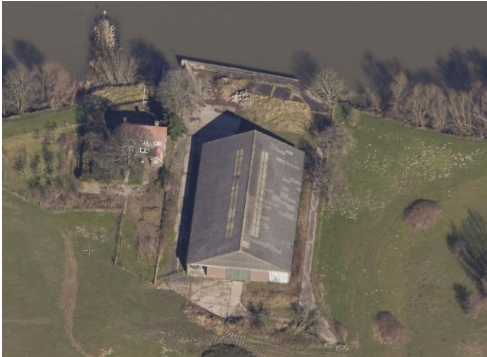
Luchtfoto huidige situatie

De beoogde grond en recreatiewoning maken deel uit van het Nationaal Park De Biesbosch en zijn buitendijks gelegen, direct aan de rivier Beneden - Merwede. De locatie is onderdeel van het Natura 2000 gebied De Biesbosch.