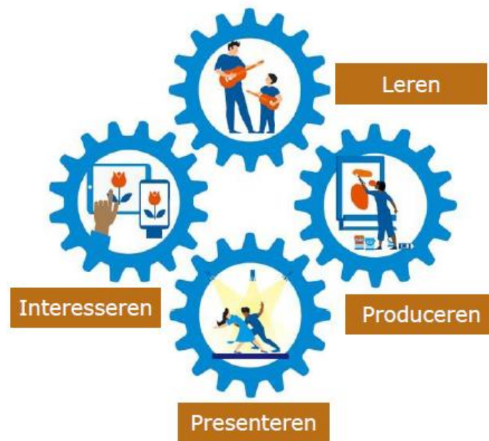
Figuur 1: Culturele cyclus