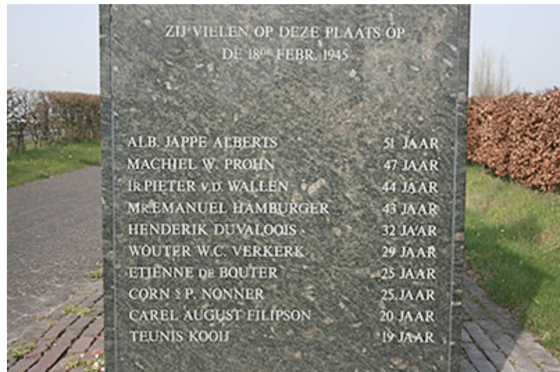
Op de zijkant staat de namen van de gefusilleerden.