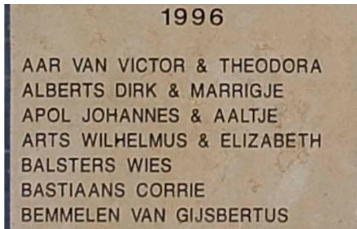
De stenen muur in Jeruzalem met daarop de naam van Van Bemmelen

Op 5 november 1996 werd aan Van Bemmelen postuum de Yad Vashem onderscheiding uitgereikt, waardoor hij erkend werd als helper van joodse onderduikers. Postuum werd hem ook het verzetshedenkingskruis toegekend.